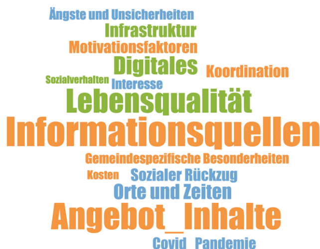
Abbildung 2: Codewolke aus MAXQDA